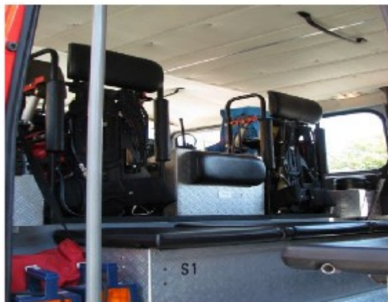
Im Innenausstattung mit Sitzelemente, die mit Ausrüstungsgegenständen ausgestattet sind. Das ermöglicht bereits auf der Abmarschphase eine Brandbekämpfung die Ausrüstung vom Angriff der Notwendigkeit Ausrüstungsgegenstände in einem Innenausstattungsbereich wie zum Beispiel, Handlungsposten.