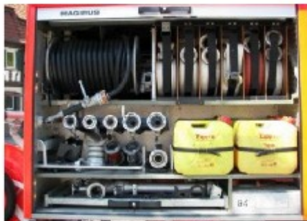
Selbstlunggriff, Ausrüstung für den Angriff der Wasserstrahlzugang, Hochdruck, Schlaumittel

Ausbildungsdruckbuch zum Brandschutzbeauftragten